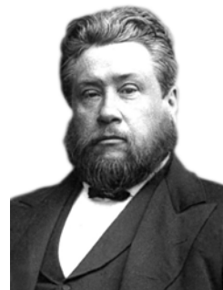
Ч. Г. Сперджен

I. Во-первых, мольба Или - это твердое основание для молитвы. Вы служите Богу и делу Христа, вы идете и проповедуете Евангелие со многими слезами и молитвами, вы пользуетесь всеми средствами, которые заповедал Христос, и спрашиваете сами себя: «А будет ли плод от моей деятельности?» Конечно, будет. Бог не послал вас с бессмысленным поручением и не дал вам сеять старые семена, которые никогда не взойдут. Но если всё - таки беспокойство одолевает ваше сердце, скажите Богу: «Господи, я все сделал по слову Твоему. Дай же мне увидеть, что это так. Я проповедовал Твое слово, а Ты сам сказал, что слово Твое не возвращается тщетным. Я молился об этих людях, а Ты сам сказал, что много может усиленная молитва праведного. Так яви же, что все это по слову Твоему». Если же вы учитель, проповедник в церкви, скажите Богу: «Я приношу Тебе, Боже, в мольбе своих детей. Я, исследовав Слово, учил их пути спасения, стараясь изо всех сил. Теперь же, Господи, оправдай мои надежды, дай мне увидеть, что души детей моих спасены Иисусом Христом, Сыном Твоим». Разве вы не видите, что, если Господь на самом деле поставил вас делать то, чем вы занимаетесь, то у вас есть все основания рассчитывать на Его поддержку? Если вы со святым рве-