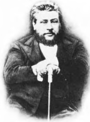
Ч. Г. СПЕРДЖЕН

«Адам, где ты?» Грех притупляет совесть, одурманивает ум, так что после согрешения человек не способен осознать всю опасность своего положения так, как смог бы сделать это до согрешения. Грех – это яд, который безболезненно убивает совесть, подавляя ее. От греха люди умирают так,